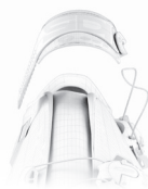
SOFT INSTEP 3

-- E' un cinturino posizionato sul collo del piede, sagomato, morbido e anatomico accoppiato con un materiale soffice per maggior comfort. Distribuisce la pressione in modo omogeneo sul collo del piede e si regola su entrambi i lati per avere una posizione perfettamente centrata del cinturino a seconda che il collo del piede sia basso o alto. Il sistema elimina la necessità di usare un distanziale. SOFT INSTEP è sostituibile.